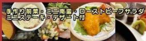
手作り前菜・ミニ南蛮・ローストビーフサラダ ミニステーキ・デザート付