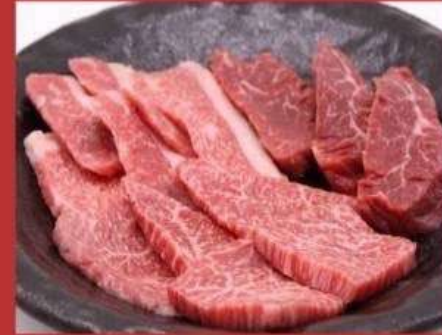
たけ家3種盛りセット 1680円