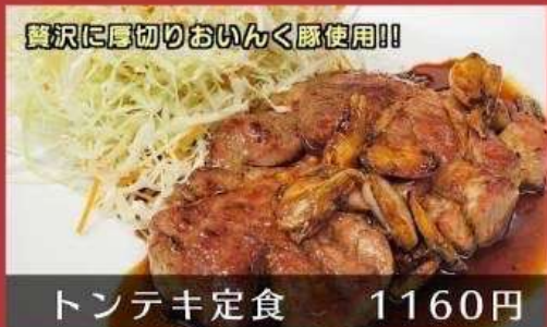
贅沢に厚切りおいんく豚使用!!