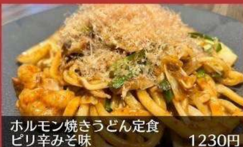
ホルモン焼さうどん定食 ピリ辛みそ味 1230円