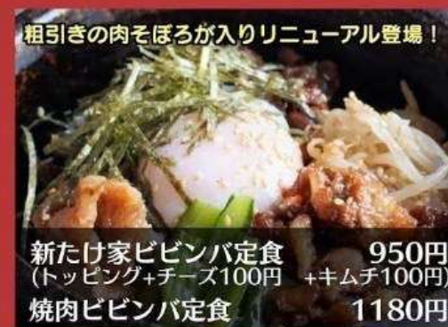
粗引きの肉そぼろが入りリニューアル登場!