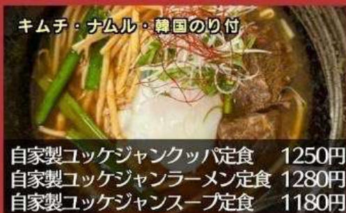
キムチ・ナムル・韓国のり付