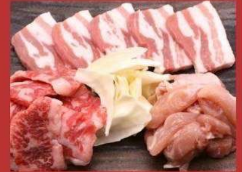
どか盛りセット 1490円