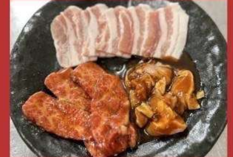
ちょい盛りセット 1090円