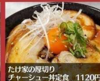
たけ家の厚切り チャーシュー丼定食 1120円