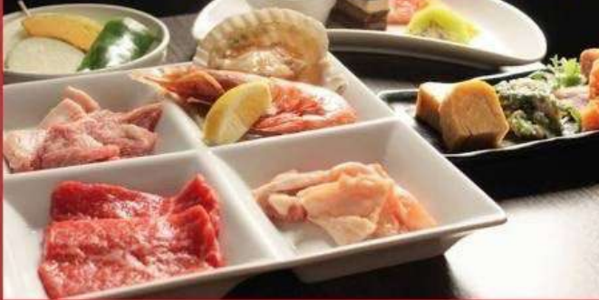
新パワーランチセット 1750円