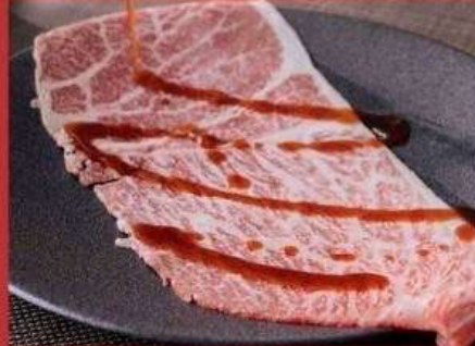
大判ロースセット 1590円