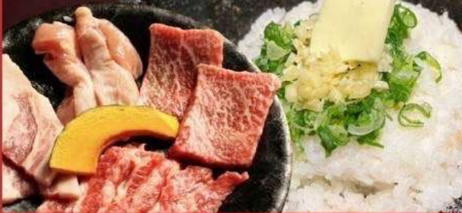
新よくばりランチセット 1520円

4種の焼肉と石焼ガーリックライスのセット アツアツのガーリックライスにお肉を混ぜればより美味しい！