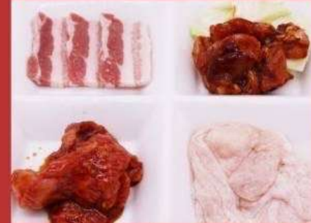
おまかせ盛りセット 1350円