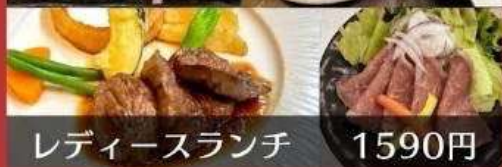
レディースランチ 1590円