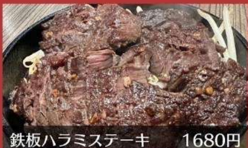
鉄板ハラミステーキ 1680円