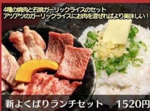
4種の焼肉と石焼ガーリックライスセット アツアツのガーリックライスにお肉を混ぜればより美味しい!