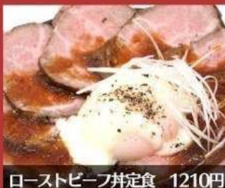
ローストビーフ丼定食 1210円