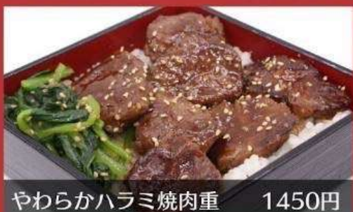
やわらかハラミ焼肉重 1450円