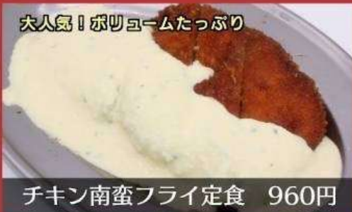
大人気! ポツユームたっぷり